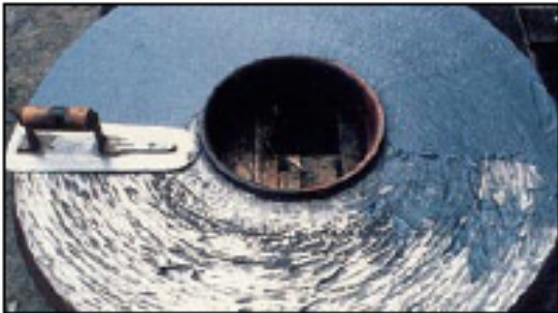
Figura 3. Reparación con revestimiento polimérico [8].

ese perfil de anclaje con picos y valles y se ha determinado que este sea mayor a 35 micras medidos entre esos picos y valles. El granallado o arenado no limpian la superficie. Si una superficie esta contaminada con grasas o con sales, no la removerá si no que quedará incorporada de alguna manera y afectarán la mojabilidad y la posibilidad de hacer efectivas las uniones entre átomos del polímero y el substrato, que confiere su inherente fuerza de adhesión. El granallado o arenado a su vez no deben introducir substancias contaminantes como sales solubles o restos incorporados de su uso anterior, durante su reciclado. En la figura 3. Se observa una reparación con revestimiento polimérico.